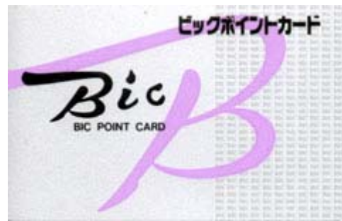
Bic Point Card